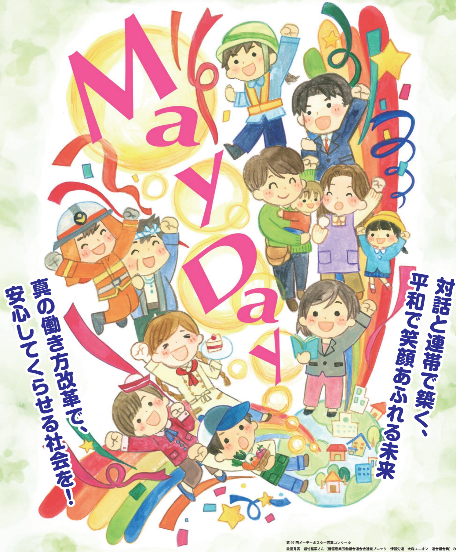
第97回メーデーポスター図案コンクール 最優秀賞 岩竹穂葉さん(情報産業労働組合連合会近畿ブロック 情報労連 大森ユニオン 連合組合員)の作品