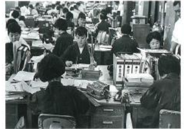
事務職として働く女性（1985年）